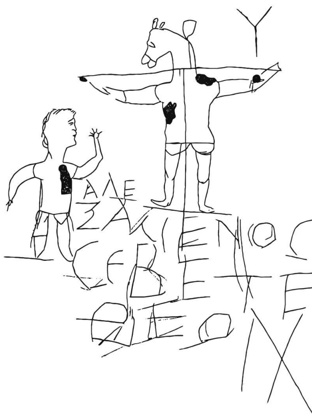
Calco del grafito esculpido en la pared

Según una interpretación, la figura en la imagen tiene la cabeza de un asno para burlarse de las creencias cristianas.